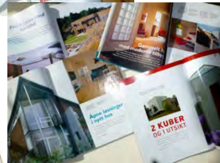
Bilder fra reportasjer i div interiørmagasiner