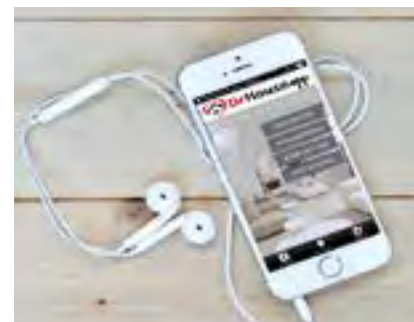
DrHouseAPP kan du laste ned fra AppStore og Google Play